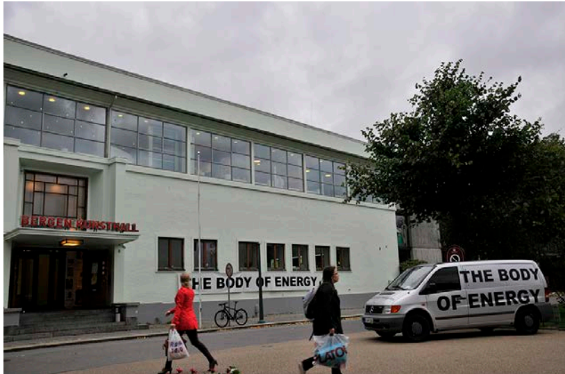
BU/Info: Stop „Body of Energy“, Kunsthalle Bergen, Norwegen